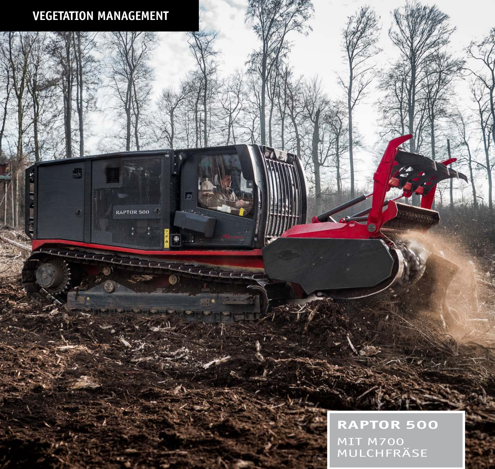
RAPTOR 500 MIT M700 MULCHFRÄSE